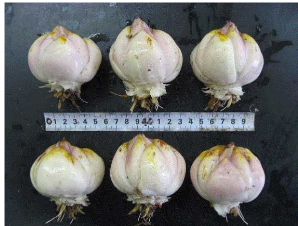
図5 高冷地農業技術センターにおける球根肥大状況（左：球根全体、右：新球）