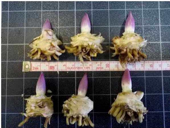
図4 中山間地農業技術センターにおけるノーズの伸長状況