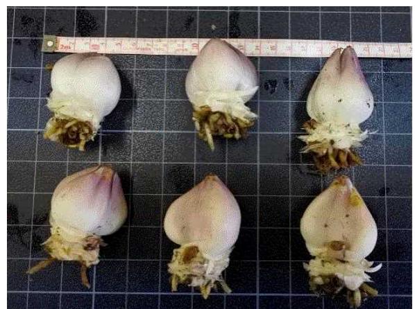
図3 中山間地農業技術センターにおける球根肥大状況（左：球根全体、右：新球）