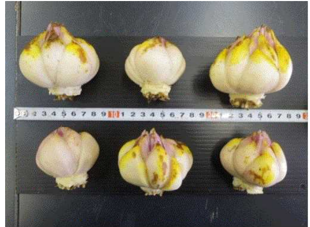
図1 園芸研究センターにおける球根肥大状況（左：球根全体、右：新球）