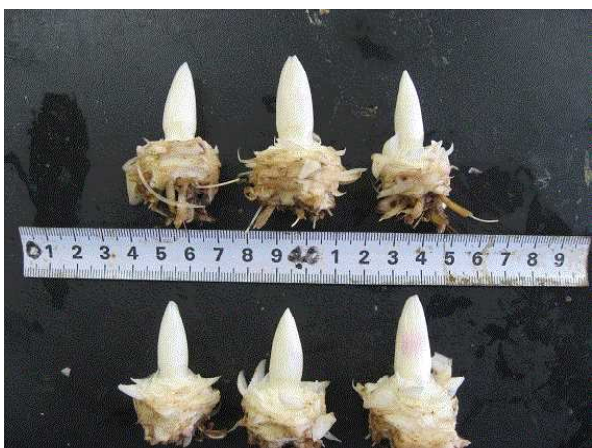
図6 高冷地農業技術センターにおけるノーズの伸長状況