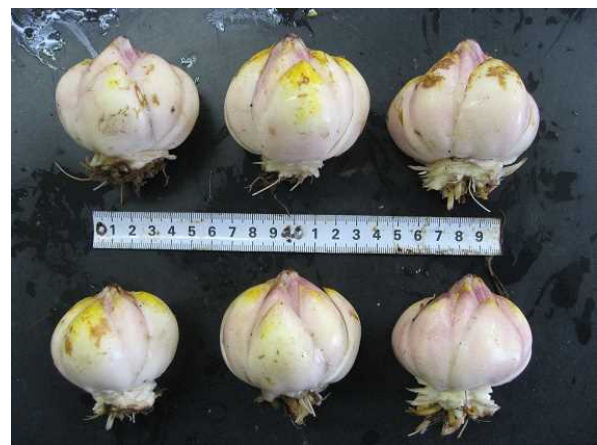
図5 高冷地農業技術センターにおける球根肥大状況（左：球根全体、右：新球）