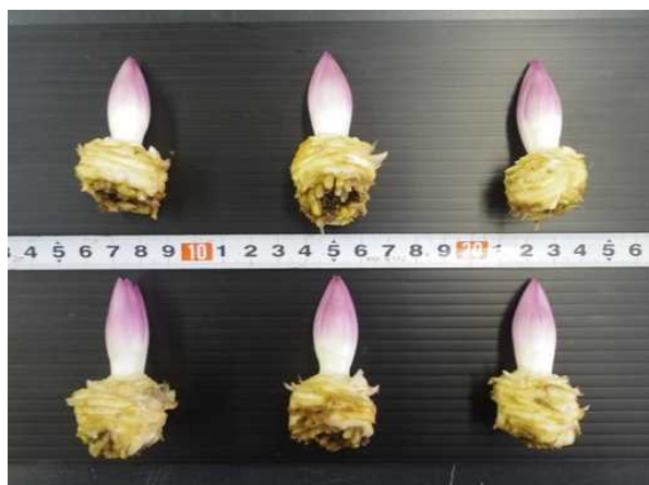
図2 園芸研究センターにおけるノーズの伸長状況