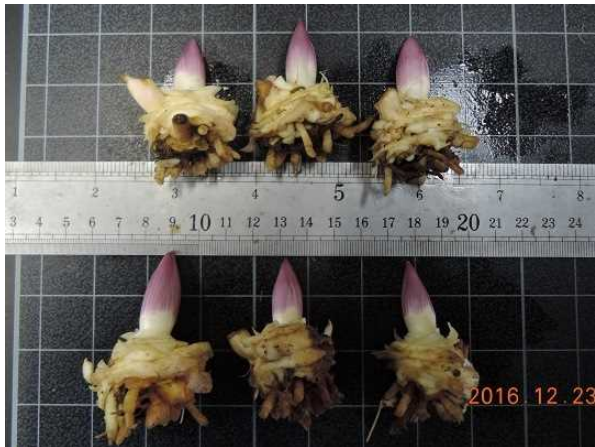
図4 中山間地農業技術センターにおけるノーズの伸長状況