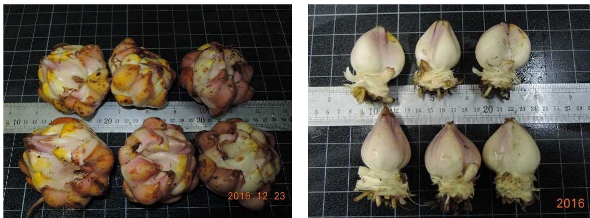
図3 中山間地農業技術センターにおける球根肥大状況（左：球根全体、右：新球）