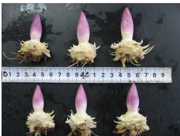
図6 高冷地農業技術センターにおけるノーズの伸長状況